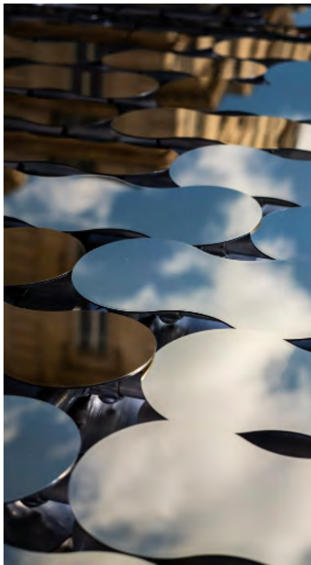
Reflect par Arnaud Lapierre © Arnaud Lapierre, Maison Rare Champagne