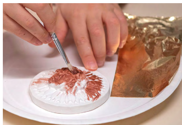
Atelier famille dorure