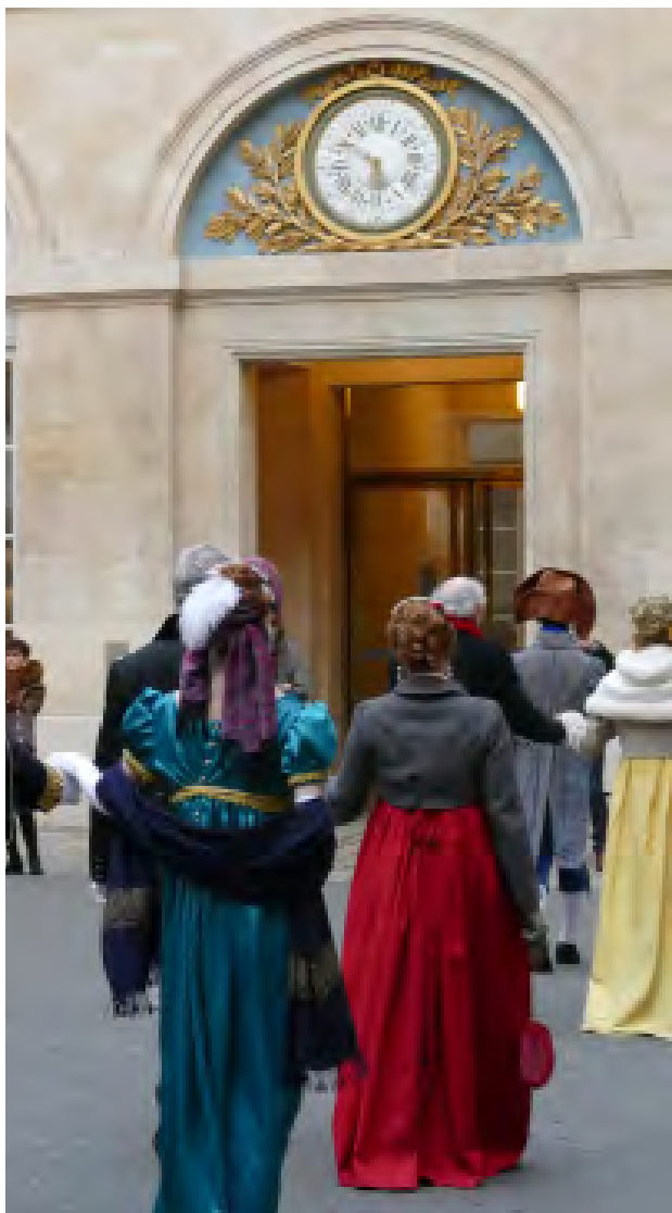
Bal Premier Empire, avec l'association Carnet de Bals

Pour les vacances de Noël, les familles pourront profiter d'un programme d'ateliers créatifs et de chorales de Noël, dans le cadre de l'évènement Contes et histoires, déployé sur l'ensemble du réseau du Centre des monuments nationaux.