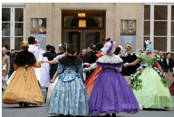
Bal d'époque