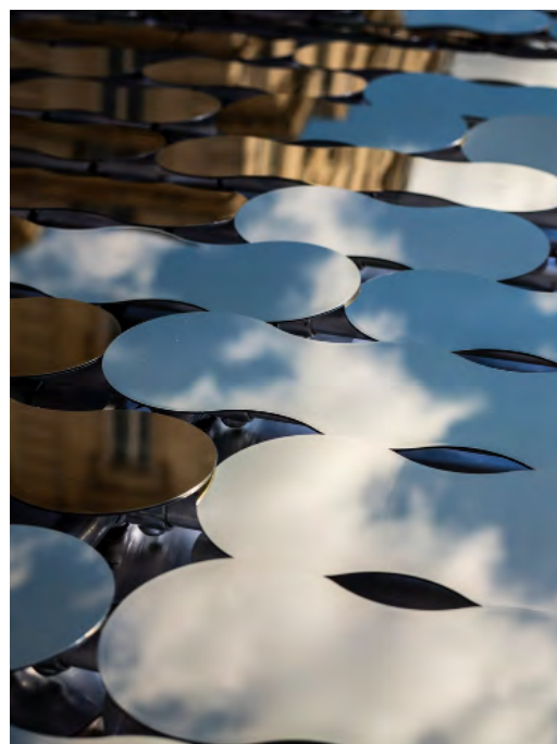
Reflect par Arnaud Lapierre © Arnaud Lapierre, Maison Rare Champagne