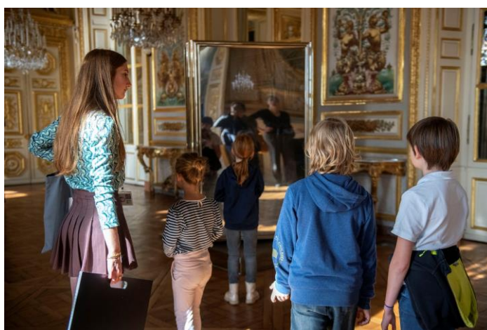
Visite famille à l'Hôtel de la Marine