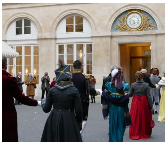
Les bals d'époque de l'Hôtel de la Marine