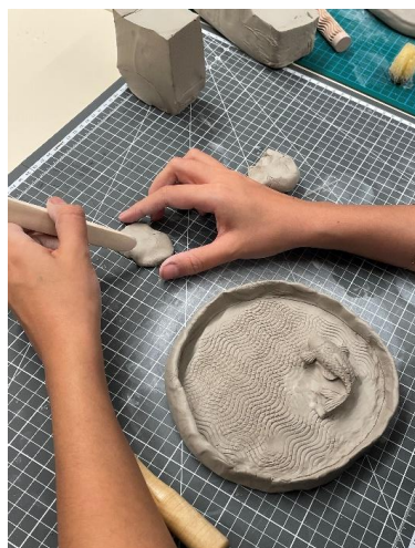
Ateliers modelage en famille