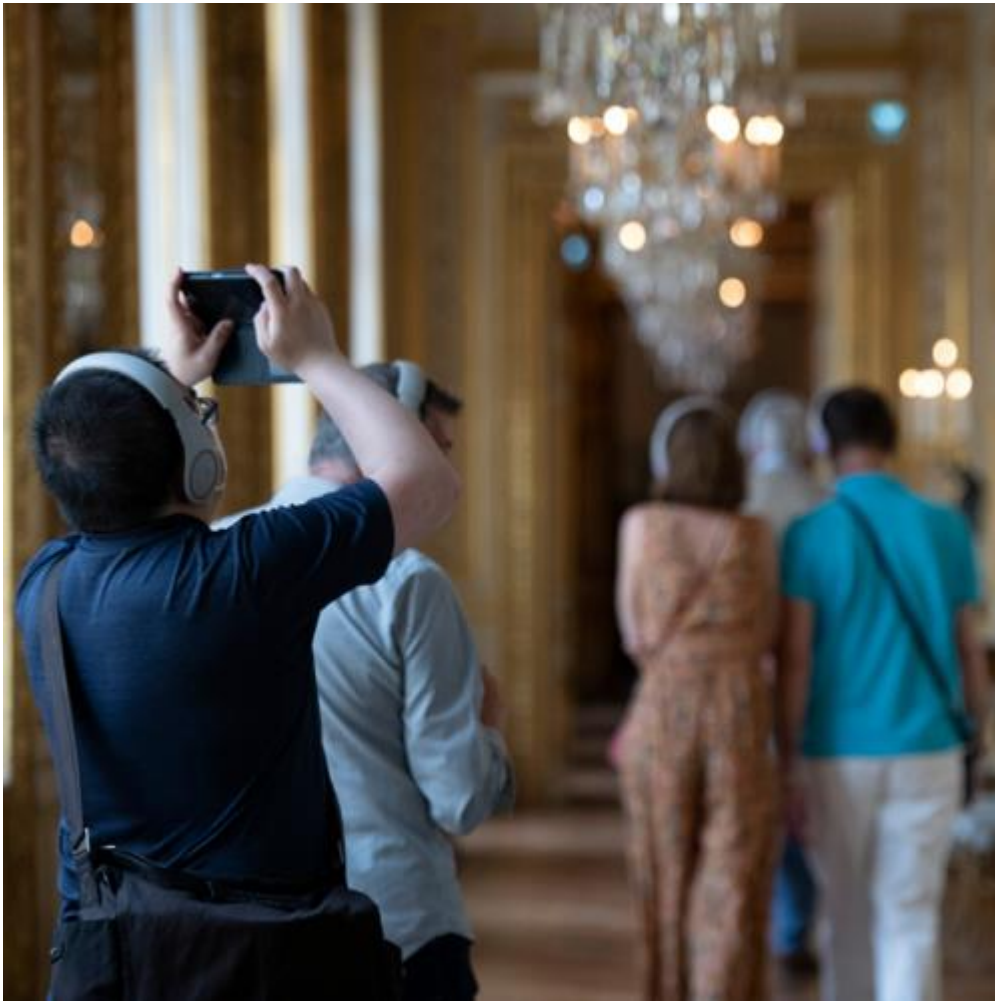
Galerie dorée