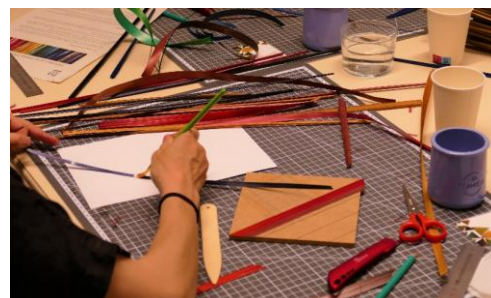
Ateliers famille « la marqueterie de paille »