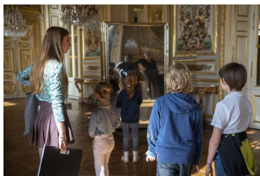
Visite famille à l'Hôtel de la Marine