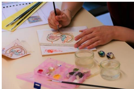
Ateliers famille « l'art de l'enluminure »