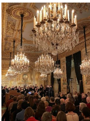
Concert dans les salons d'apparat de l'Hôtel de la Marine