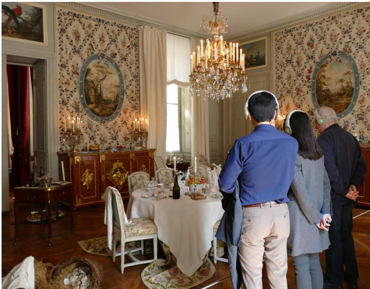
Salle à manger des Appartements des Intendants du Garde-Meuble de la Couronne