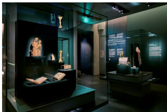
Vue de l'exposition Trésors médiévaux du Victoria and Albert Museum : quand les Anglais parlaient français de la Collection Al Thani