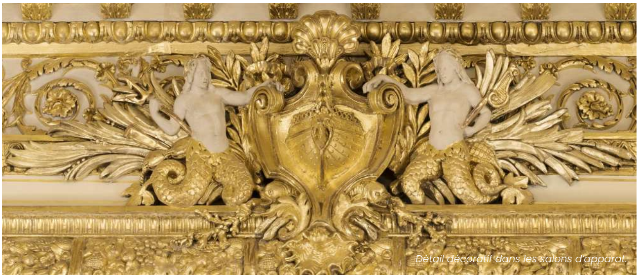
Détail décoratif dans les salons d'apparat.

Atelier : Chaque élève se voit remettre un dossier documentaire sur l'expédition de son choix. Sur la base de ces éléments, il est invité à produire une carte retraçant les grandes étapes de cette expédition.