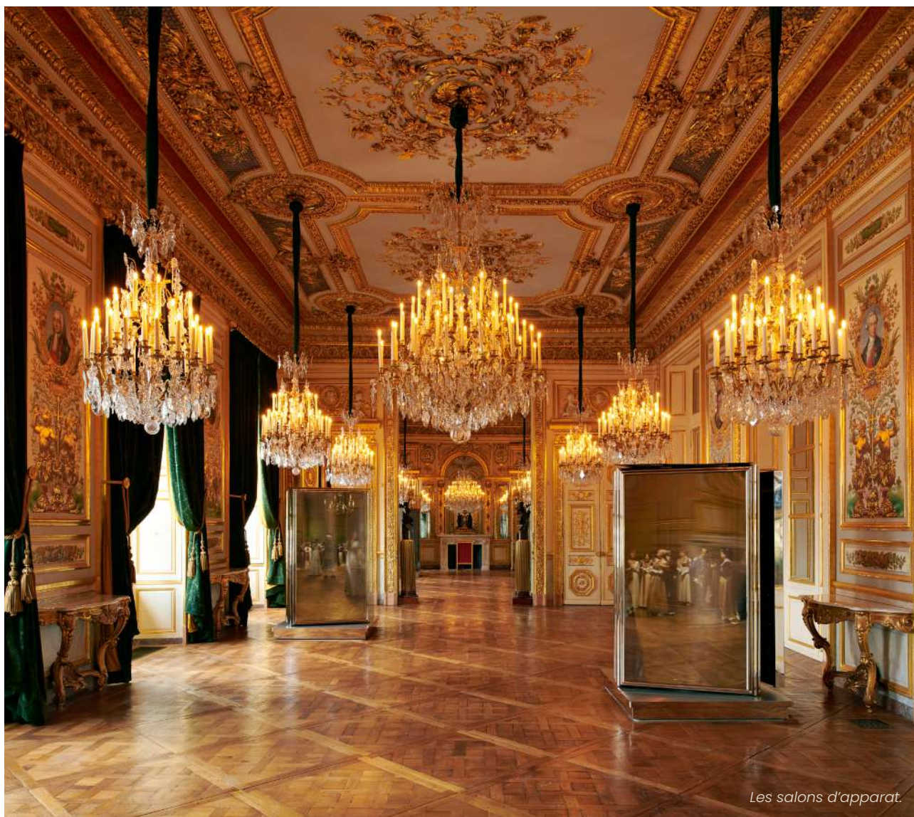
Les salons d'apparat.

Visite sonore disponible en français, anglais, espagnol, allemand, italien, russe, arabe, japonais et chinois