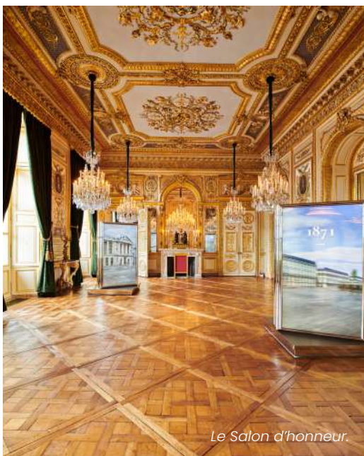
Le Salon d'honneur.