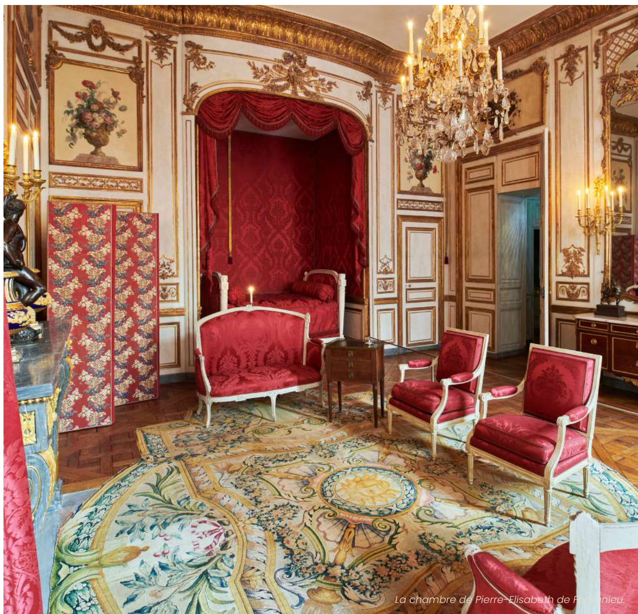
La chambre de Pierre-Elisabeth de France.

En dehors des visites en groupe scolaire, les enseignants exerçant en France bénéficient de la gratuité du droit d'entrée sur présentation du pass éducation en cours de validité avec une photo ou du certificat d'exercice de l'année scolaire ou universitaire en cours. Les auxiliaires de vie scolaire exerçant en France bénéficient de la gratuité sur présentation d'un justificatif professionnel.