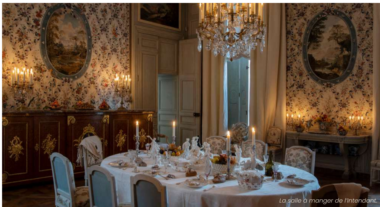
La salle à manger de l'intendant.

Atelier : Après avoir sélectionné 5 images de leur choix, les enfants composent leur carton de cavagnole et procèdent à la mise en couleurs.