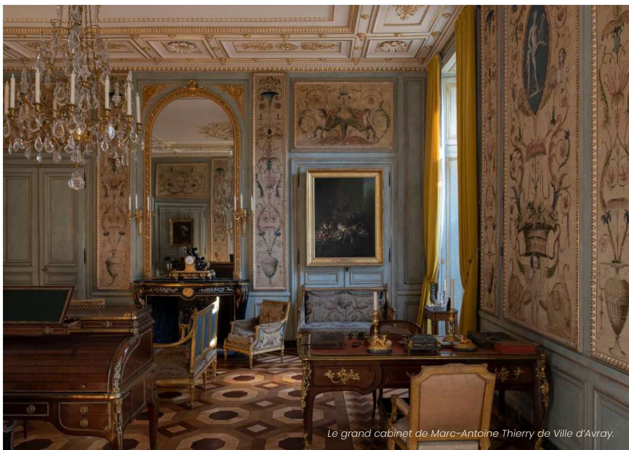
Le grand cabinet de Marc-Antoine Thierry de Ville d'Avray.

Le jour de votre visite, l'horaire de rendez-vous sera le même pour tous. Chaque groupe bénéficiera de la présence d'un animateur du patrimoine. Les deux départs seront décalés de 15 minutes.